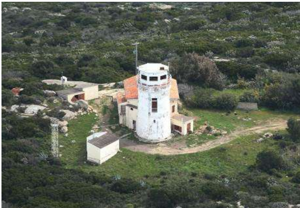
Sémaphore et ses annexes