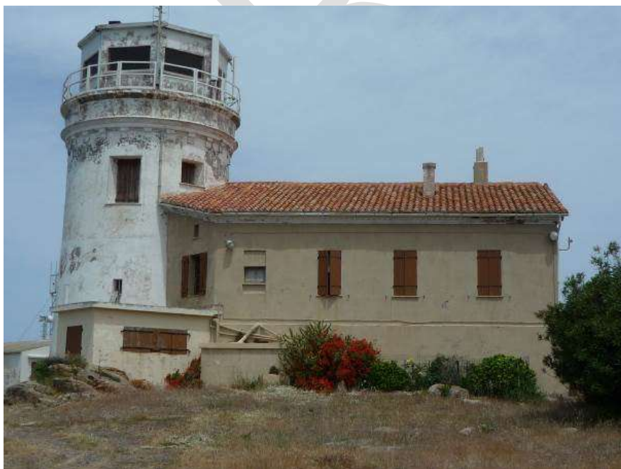
Sémaphore de Cavallo

Actions de gestion : Surveillance de l'état du bâti, des annexes et entretien de leurs abords. Veille au risque de squat.